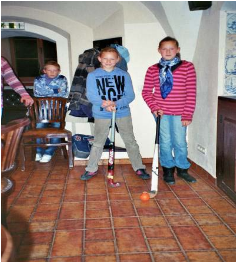
Aber sie waren die wahren Champions – unsere Vilniuser Kinder