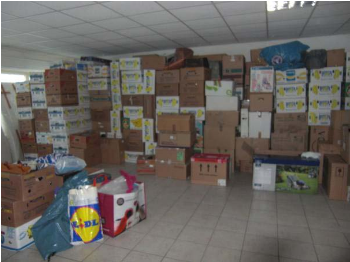
Abbildung 3: Kleidung, Spielzeug, Haushaltsgegenstände