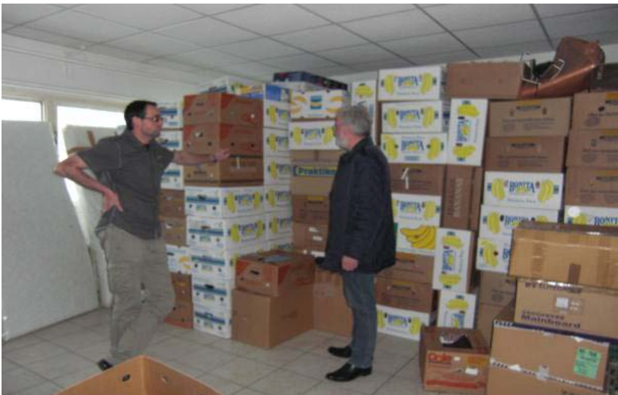
Abbildung 4: Kurze Lagerbesprechung – ca. 300 Bananenkartons warten auf den Abtransport