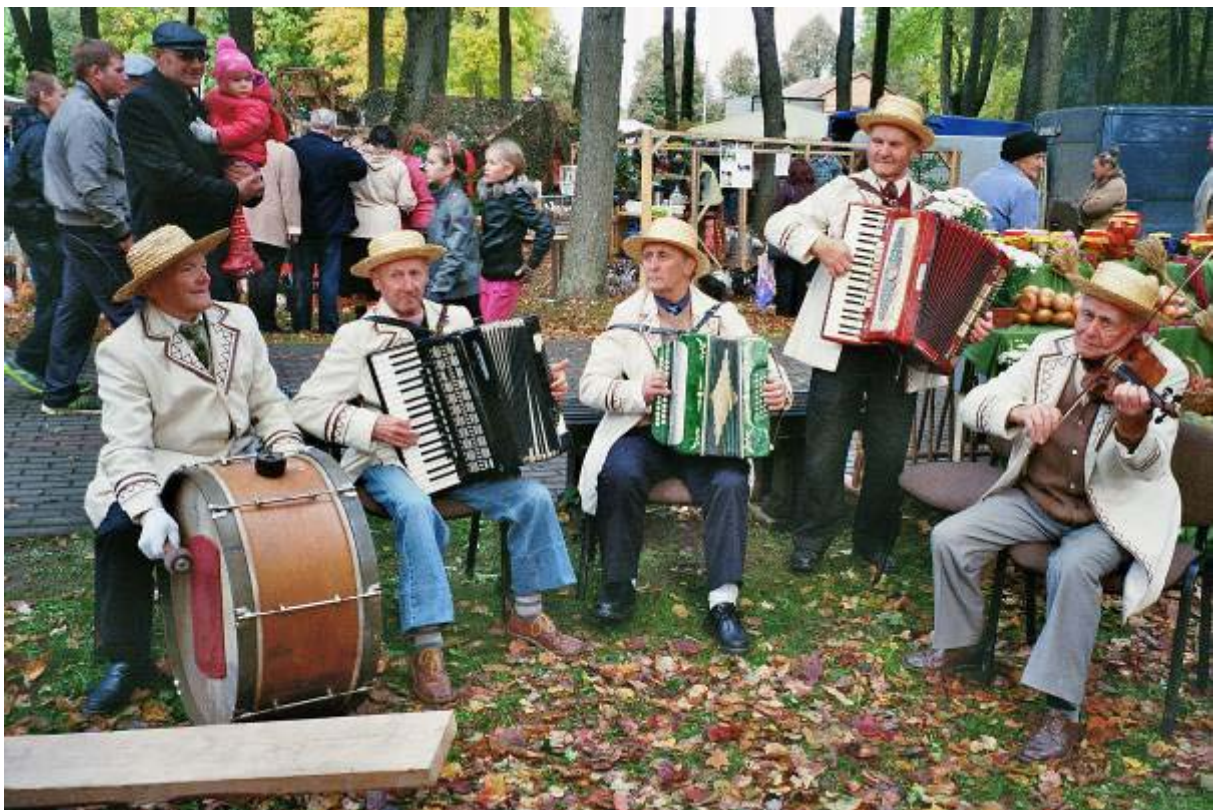
Erntedankfest, Die Festtagsmusik