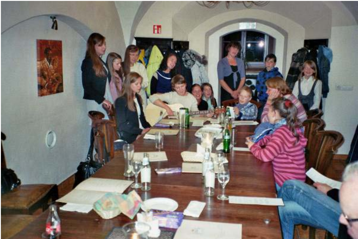
Zusammen singen macht Spaß