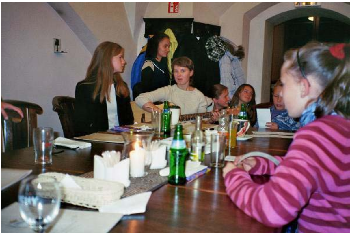
Unterstützt von unseren Helferinnen vom Sozialzentrum beim großen Familientreffen