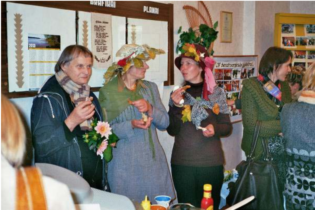
Feiern macht hungrig und durstig